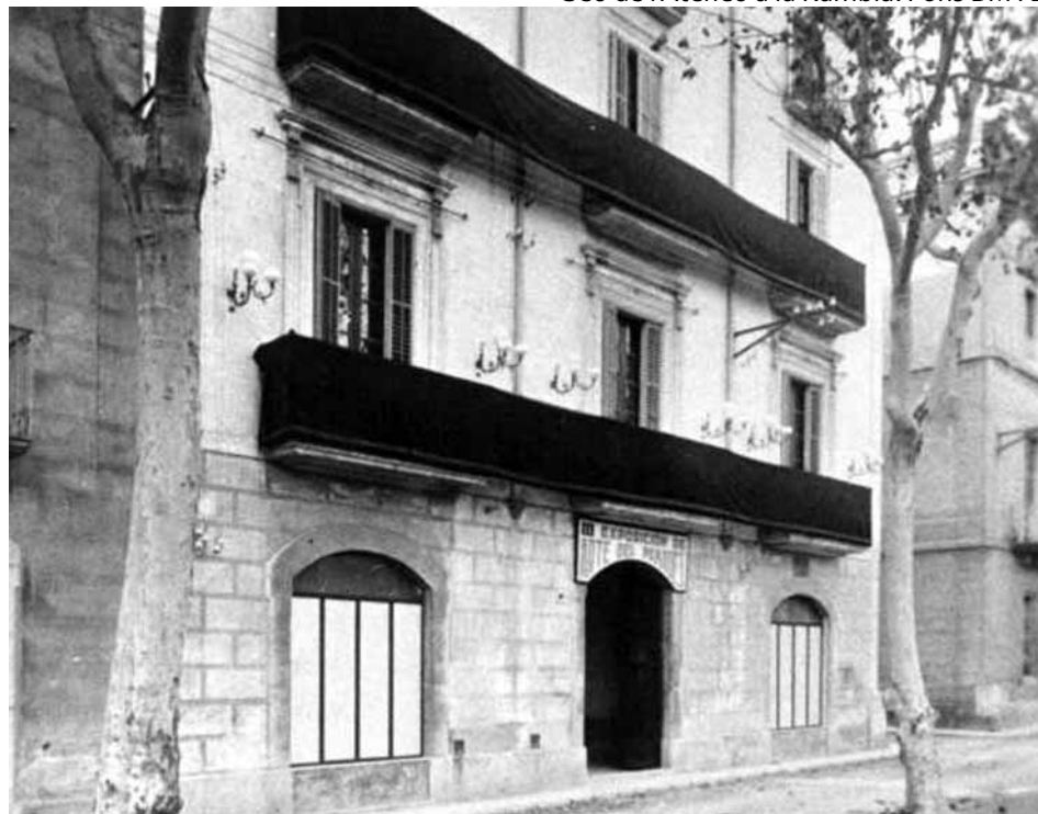
Seu de l'Ateneu a la Rambla.

Els estatuts del nou Ateneu de Vilanova i la Geltrú, presidit per Llanas, s'aproven el gener de 1881. El text recollia com a objectiu prioritari el de "cultivar las ciencias, las letras y las artes, estrechar los vinculos de amistad y compañerismo entre los individuos que a él pertenecan; aproximar las clases sociales, y promover el perfeccionamiento moral y el fomento de los intereses materiales". La institució recollia així la tradició d'instrucció obrera impulsada pel desaparegut Centro Instructivo Villanovés. Des de ben aviat es van impartir ensenyaments adaptats a les diferents necessitats de la població, es van programar conferències i es va crear una important biblioteca. Entre el 1882 i el 1915 es publicaria el Boletín del Ateneo de Villanueva y Geltrú . El 1880 l'Ateneu encapçalava la redacció d'un projecte de Centre Teòric i Pràctic d'Arts i Oficis que seria una realitat l'any següent. Era el precedent de l'Escola d'Arts i Oficis i de la posterior Escola Superior d'Indústries. Des de la fundació i fins al 1888 l'Ateneu tingué la seu social al carrer de Pàdua, cantonada amb el carrer Sant Pau. Per aquelles dates havia de traslladar-se a l'im-