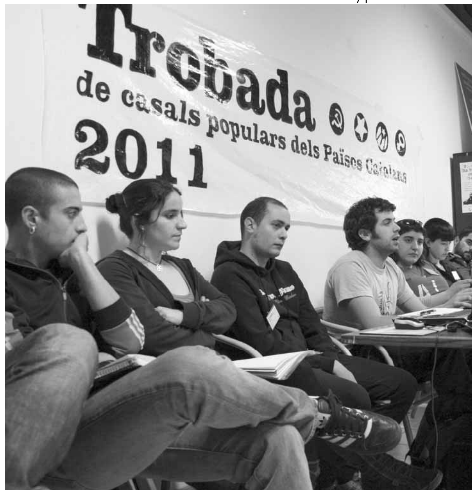
Sabadell acollí l'any passat la 1a Trobada

Més enllà d'aquest objectiu general concret, consideràvem que