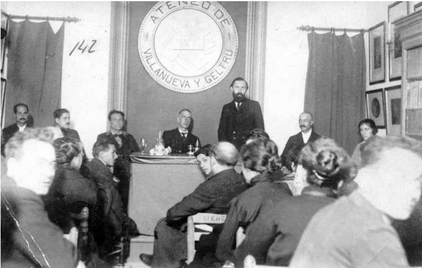
Reunió de socis de l'Ateneu.

“ Som fervorosos demòcrates que aspirem al govern del poble pel poble